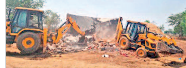
कुल्हाड़ी में लंबे समय से शासकीय भूमि पर अवैध कब्जे किए गए थे, जिनमें पक्के निर्माण, दीवारें और घेराबंदी शामिल थीं। प्रशासन ने पहले ही अतिक्रमणकारियों को नोटिस जारी कर समझादेश दी थी। इसका असर यह हुआ कि