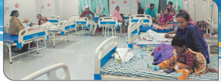
बच्चों के फ्रेक्चर, सर्जरी व ऑपरेशन की सुविधा सोनोग्राफी, एक्सरे एवं सभी प्रकार के पैथालॉजी जांच सुविधा उपलब्ध

खबर संक्षेप सड़क हादसे में बाइक सवार दो युवकों की मौत