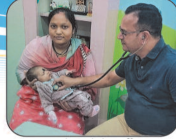
24 घंटे बच्चों के भर्ती व आपातकालीन इलाज