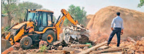
प्रकार का विरोध या तनाव देखने को नहीं मिला, जिससे प्रशासन ने राहत की सांस ली। जिला प्रशासन ने स्पष्ट किया है कि शासकीय भूमि पर अवैध कब्जा किसी भी स्थिति में बर्दाश्त नहीं किया जाएगा। सार्वजनिक भूमि को मुक्त कर उसे