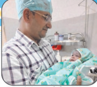
बच्चों के संपूर्ण टीकाकरण की सुविधा उपलब्ध