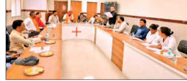
विकास कार्यों एवं प्रस्तावों को सर्वसम्मति से स्वीकृति प्रदान की गई।