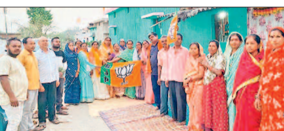
शक्ति केंद्र देवपुर में गांव चलो-बस्ती चलो अभियान चलाया गया।